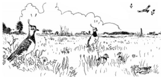
gezin aan de scharrel, ouders oplet-tend

Bij een van de leden van het collectief Rijn & Gouwe Wiericke is een plas dras pomp geplaatst. Er draait een live stream mee en leuk om te kijken (de camera draait bij voldoende zonuren).